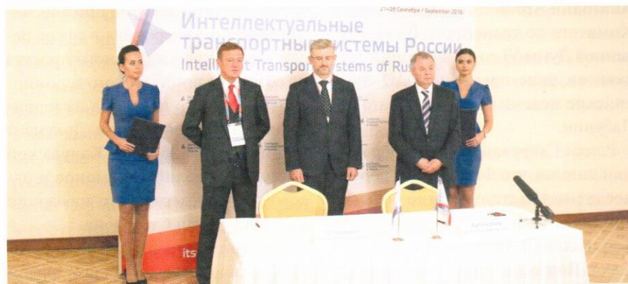
2. Руководитель Федерального дорожного агентства Роман Старовойт и губернатор Калужской области Анатолий Артамонов подписали меморандум о намерениях в сфере реализации инвестиционного проекта по созданию комплексного дорожно-испытательного полигона на территории Калужской области

Основой для получения объективных данных о фактически выполненных объемах работ является применение автоматизированных навигационных систем диспетчерского управления работой машин и механизмов по содержанию автодорог. Такое условие выполнено Росавтодором путем внедрения единой автоматизированной системы навигационного диспетчерского контр-