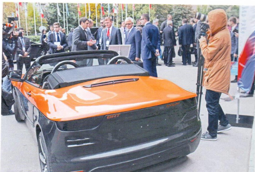
4. Роман Старовойт и Игорь Астахов ознакомились с перспективным автомобилем – родстером «Крым», разработанным студентами и аспирантами МГТУ имени Н.Э. Баумана

сионное соглашение – в нем четко регламентированы условия, которые должны соблюдать все стороны процесса. Система «Платон» будет эксплуатироваться инвестором 13 лет. Поступающие средства направляются в дорожный фонд – это делается ежедневно.