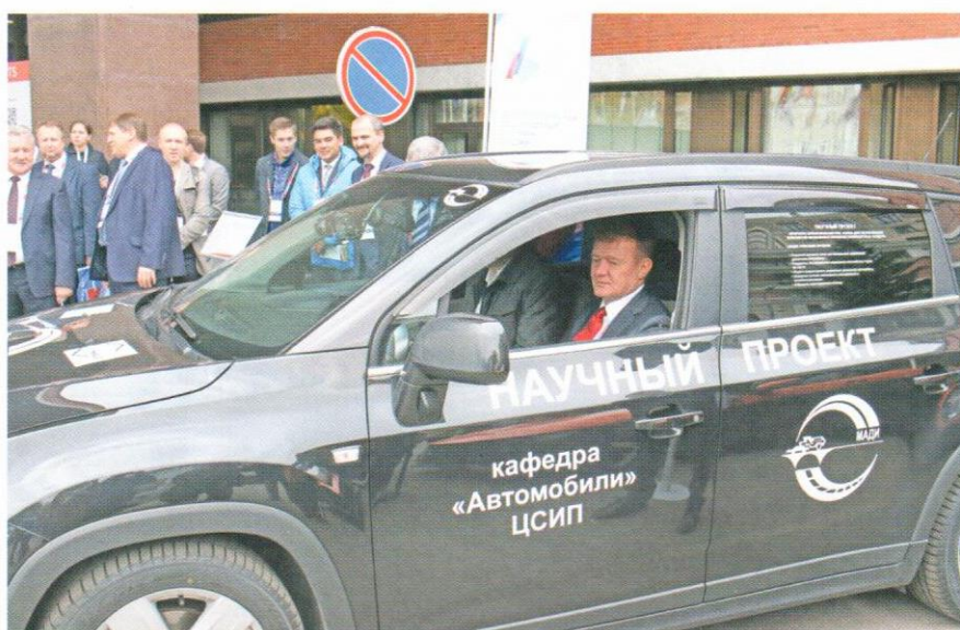
3. Роман Старовойт проехал, не касаясь руля, на беспилотном автомобиле, созданном на кафедре «Автомобили» МАДИ при поддержке Центра студенческих инженерных проектов (ЦСИП) МАДИ

Также в Федеральном дорожном агентстве активно работает, постоянно развиваясь, система автоматизированных пунктов весового контроля. Это одна из важнейших задач сохранности автодорог. Еще в 2013 году Росавтодором был утвержден план мероприятий по развитию системы весогабаритного контроля в сети автодорог общего пользования. Обустроенные пункты весогабаритного контроля работают в автоматизированном режиме. Все они связаны в единую систему, которая позволяет контролировать каждое проходящее через весы транспортное средство и определять нагрузку по каждой оси, полную массу, расстояние между осями, количество скатов на оси, габариты. Автомобиль по госномеру пробивается по базе данных ГИБДД — определяется собственник транспортного средства. По данным Росавтодора устанавливаются све-