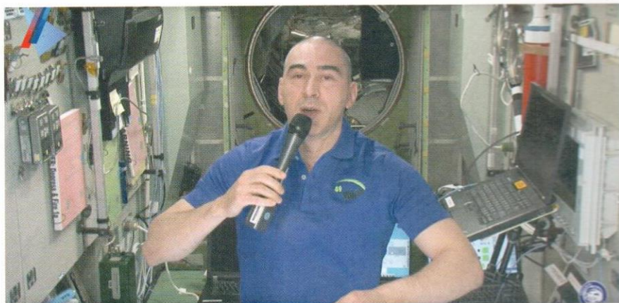
1. Видеоприветствие командира сорок девятой экспедиции на Международную космическую станцию Анатолия Иванишина к участникам форума

с применением новейших технологий, в том числе с интеллектуальными транспортными системами. Испытательный комплекс будет создан по схеме государственно-частного партнерства. По словам Романа Старовойта, Калужская область на сегодняшний день является одним из лидеров среди российских регионов по инновациям различного рода, применению новых технологий, в том числе в области дорожного строительства. Поэтому не случайно выбор пал на эту область. А учитывая опыт Анатолия Артамонова и его команды по привлечению инвесторов, можно не сомневаться, что этот проект обречен на успех.